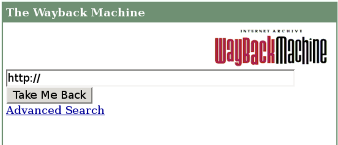
Figura 5.23. Internet Archive con la maschera di inserimento per la ricerca.

Evidentemente è sufficiente indicare l'indirizzo URI per ottenere un elenco di copie in vari momenti nel tempo. Per esempio, si potrebbe cercare l'indirizzo http://www.gnu.org/philosophy ; 4 la figura successiva mostra cosa si potrebbe ottenere.