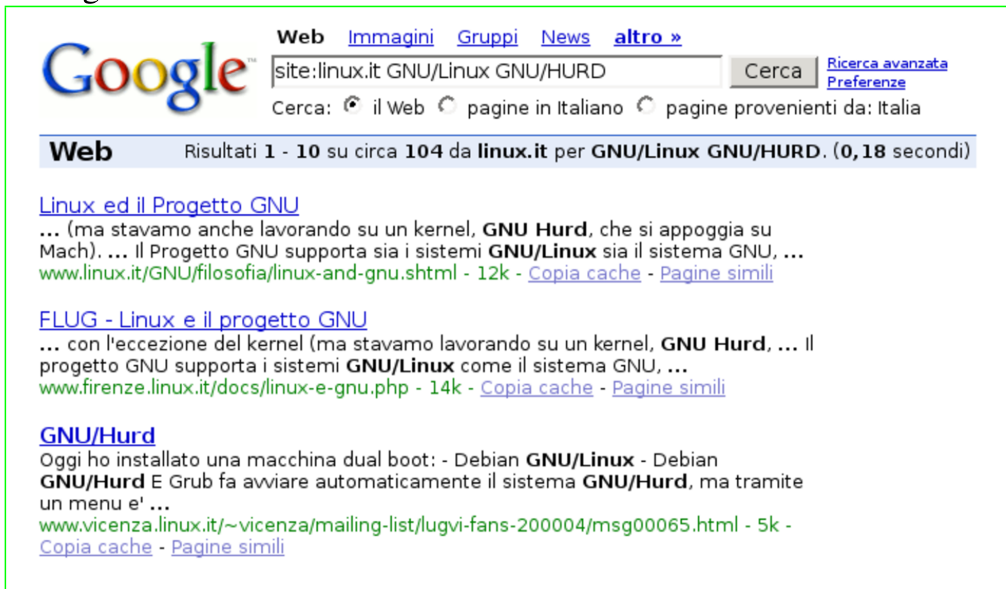
Figura 5.18. Risultato di una ricerca con il vincolo del sito.

Naturalmente il vincolo del sito può essere più stretto, per esempio aggiungendo una parte del percorso in cui devono trovarsi i documenti cercati.