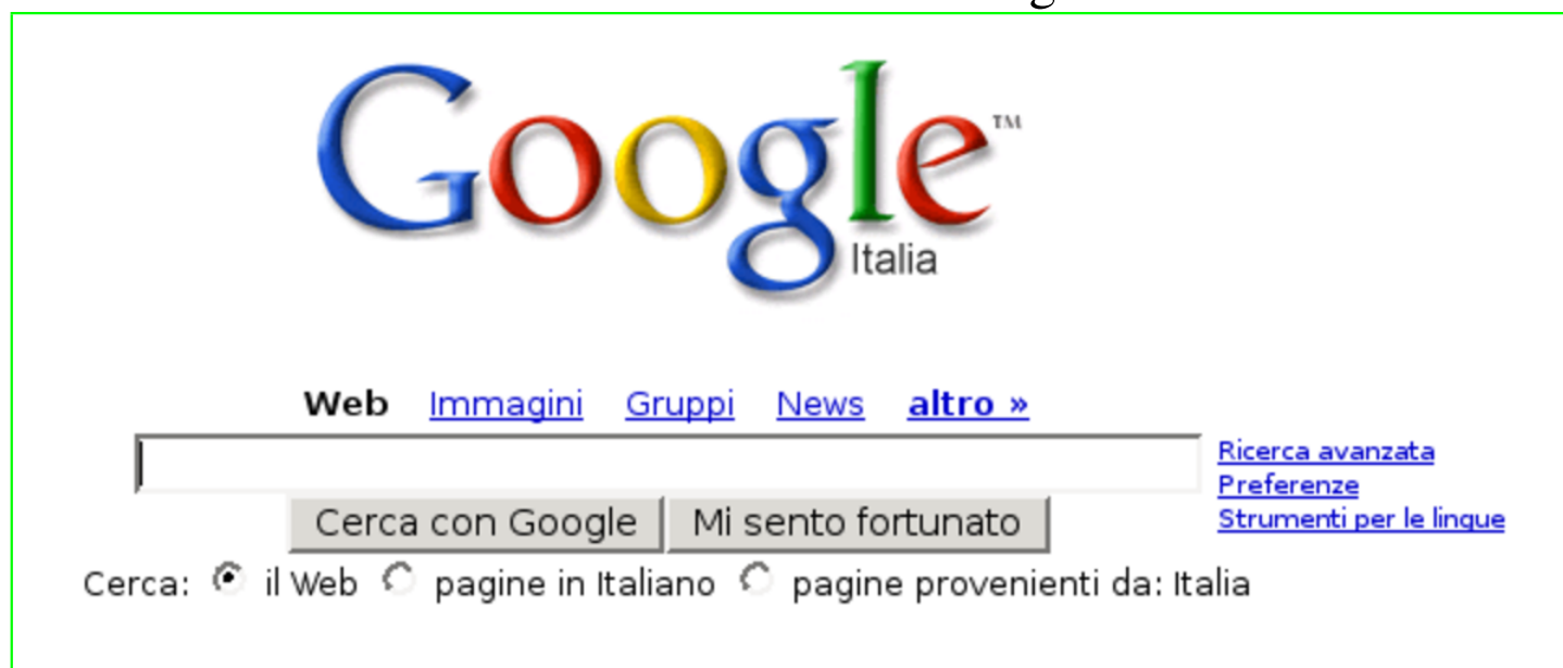
Figura 5.16. Maschera per l'inserimento di un'espressione di ricerca attraverso il servizio offerto da Google.

Supponendo di voler cercare documenti che contengono simultaneamente riferimenti a GNU/Linux e GNU/Hurd, si potrebbe indicare l'espressione ' GNU/Linux GNU/HURD ', senza bisogno di operatori (simboli) particolari. La figura 5.17 mostra il risultato della ricerca.